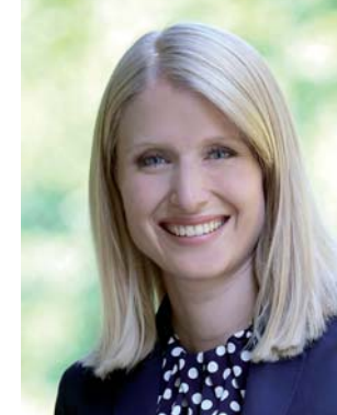
Mag. a Christine Haberlander Landeshauptmann-Stellvertreterin